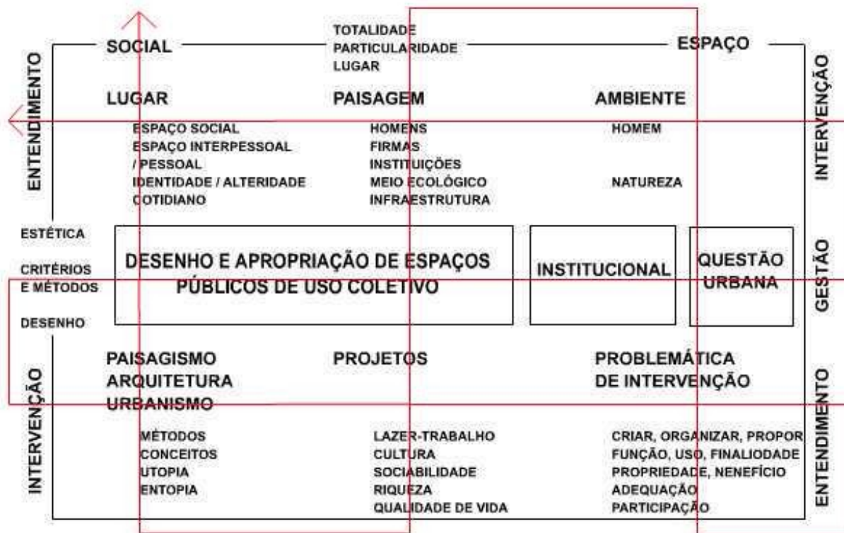
figura 2: arquitetura, gestão e paisagem: múltiplos fluxos necessários

Artigos do autor de interesse à abordagem proposta , quase todos estão disponíveis também em http://www.ambiente.arq.br (publicações).