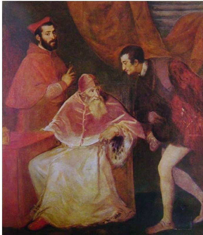
TICIANO, papa Paulo III e sobrinhos Alexandre e Otavio Farnese, 1546

Mas também houve pinturas obscenas, como a que Ticiano fez do mesmo papa Paulo III e seus sobrinhos. A história da família Farnese, e como chega ao papado é muito cândida, como vimos. Foram imortalizados por vários artistas, quase sempre bem vestidos. O próprio Alexandre VI, Bórgia, foi um grande mecenas. O Apartamento Bórgia (1492-95), realizado nas 6 salas construídas por Nicolau V (1449-55), tornam-se residência de Alexandre VI, com decoração de Pinturicchio e depois por discípulos de Rafael.