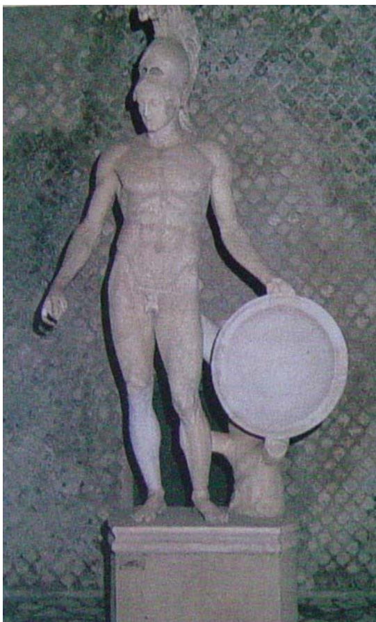
Escultura na Vila Adriana: quem ousaria vesti-la hoje em dia?

A mim interessa discutir a questão cultural e dos valores em que isso se dá. Já temos aí uma enorme contribuição do episódio, ultrapassando a circunstância da praça em que ocorreu. O que vejo em questão não é a defesa do nu na arte. Essa discussão já está superada. A arte dita pré-histórica está cheia de cenas de relação sexuais, além de caçadas e lutas, tombadas no Brasil como patrimônio histórico, isto é, como cultura. Várias estatuetas em todos os livros de história da arte são admiradas como arte e como cultura, associadas a ritos de fecundidade; realmente algumas são bastante pródigas, nos museus do mundo todo. Os romanos, que nunca foram um exemplo de comportamento pudico, mantinham por todos os lados, inclusive espaços públicos, como também nós temos, estátuas de nus femininos e masculinos. Não seria o David, de Michelangelo, um bom exemplo do nu no espaço público?