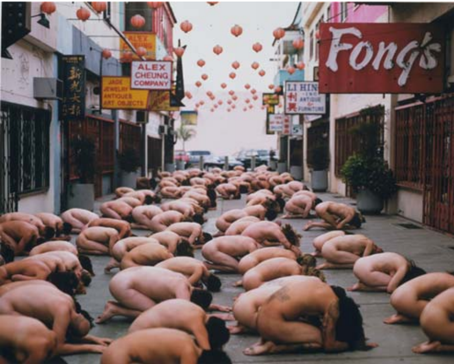
Spencer Tunick, Chinatown, LA (First Sunrise) 2000, http://www.i-0.com/artist.php?artist_id=19&page=images&work_id=189

O artigo de Rubens Pillegi, publicado na FOLHA DE LONDRINA, na seção coluna Alfabeto Visual, e que com sua concordância publicamos nesta edição de LINGUAGENS, trata da questão do nu na arte. Sua intenção foi, portanto, claramente, uma discussão da sociedade. Apesar dos eventos decorrentes da ação na praça ultrapassarem o previsto, colocou para mim em questão várias coisas importantes nesse momento e algumas nada fáceis de pensar, para além da questão da arte. Por exemplo, da liberdade individual e de expressão e dos limites dessa expressão, bem como da ação social sobre as divergências, os tabus e consensos, os lugares comuns e o respeito dos diversos lugares, e tantas coisas para o que Hannah Arendt será pouco. A questão da arte é, assim, a mais fácil de resolver aqui. A discussão, a meu ver, desloca-se para além do modo como a sociedade lida com isso, considerando por vez cultura, por vez estímulo ao consumo, por vez lazer, mas de modo algum estranha ao nu.