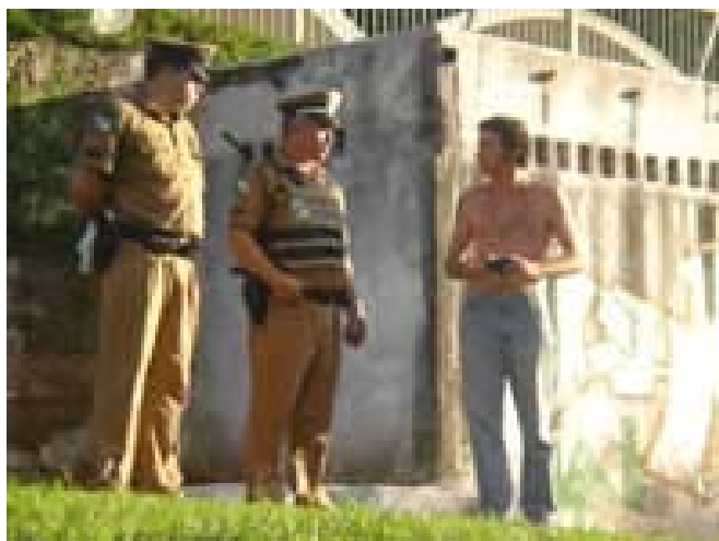
Dia do Nada, performance na Praça Rocha Pombo em Londrina, outubro de 2005